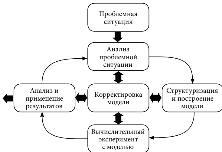
Рис. 1. Этапы математического моделирования и их взаимодействие

На рис. 1 изображены основные этапы математического моделирования и их взаимодействия.