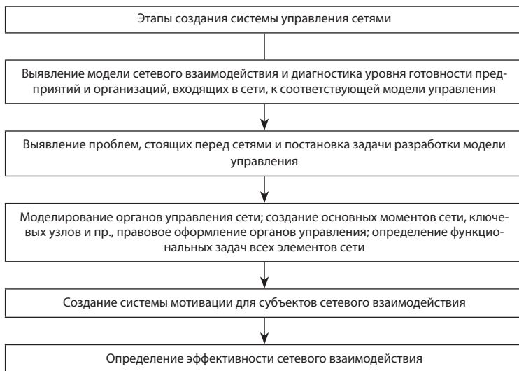
Рис. 2. Этапы создания системы управления сетевыми формами взаимодействия (составлено авторами по 16 )

Формирование сетевых форм взаимодействия в историко-культурном туризме включает использование эффективных управленческих технологий (рис. 2).