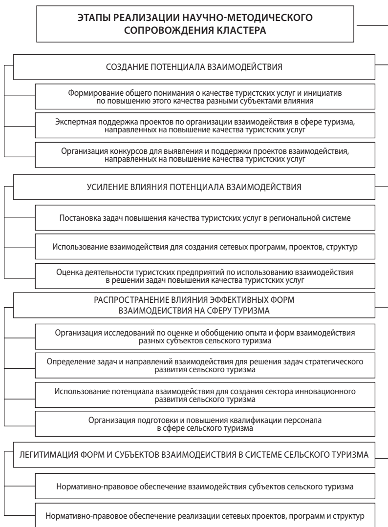
Рис. 3. Этапы реализации научно-методического сопровождения историко-культурных кластеров (составлено автором по 17 )