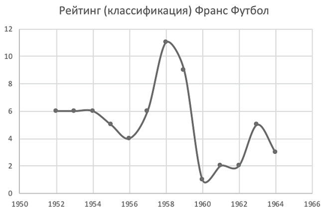
Рис. 2. Динамика рейтинга сборной СССР по футболу до и после реформы

Главное новшество состояло в увеличении числа команд национального турнира, а, следовательно, и числа игр в нем. Сравним старт чемпионатов страны 1959 и 1960 гг. К 1 июня было сыграно 7 туров в 1959 г. и 9 туров в 1960 г., к 1 июля 8 и 14 соответственно. Разница очевидна. Обратим внимание, что среднее число дней между матчами в сезоне 1959 г. составляло почти 10 дней (9,67), а в сезоне 1960 — 6 дней на первом, предварительном этапе и 6,1 на втором, заключительном 61 . Иными словами, три месяца первенства были вполне достаточным сроком для проявления последствий увеличения числа команд. Найденная зависимость успехов сборной от числа игр в национальном первенстве отражает важность в спорте не только тренировок, но и еще большую важность состязаний 62 . Роль числа матчей для ключевых показателей спортивной лиги уже отмечалась в специальной литературе 63 .