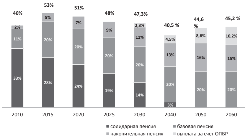
Рис. 3. Коэффициент замещения дохода пенсионными выплатами с учетом введения обязательных пенсионных взносов работодателя (5%)

ки на бюджет и может позволить государству потенциально повысить социальные стандарты пенсионного обеспечения из бюджета 49 .