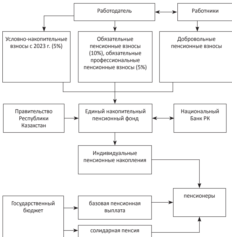
Рис. 1. Функционирование пенсионной системы Казахстана

ности воздействия демографическому кризису. Научные исследования и отчеты авторитетных организаций уже не раз подтверждали наличие такой проблемы, как старение населения 42 .