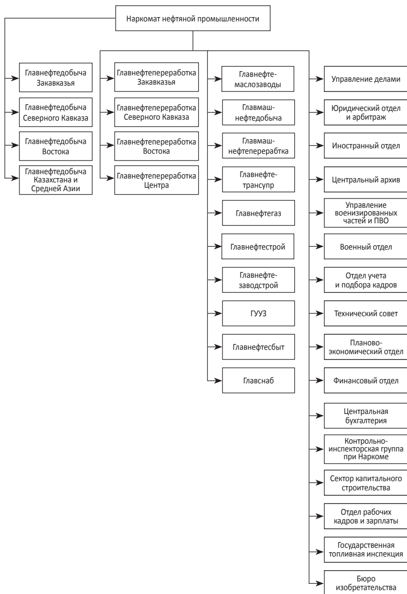
Рис. 3. Структура Наркомата нефтяной промышленности СССР в 1940 г.