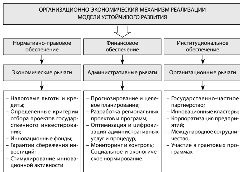
Рис. 1. Ориентировочная структура механизмов реализации модели устойчивого развития региона 7

лей устойчивого развития и инвестиционных рисков, снижения административных барьеров (рис. 1).